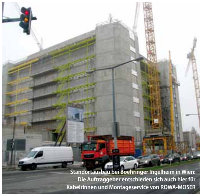
Standortausbau bei Boehringer Ingelheim in Wien: Die Auftraggeber entschieden sich auch hier für Kabelrinnen und Montageservice von ROWA-MOSER